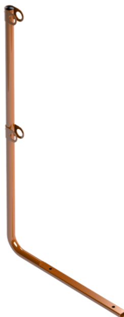
Ståndare skyddsräcke gångbrygga/takstege