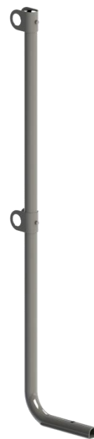
Ståndare skyddsräcke släta tak